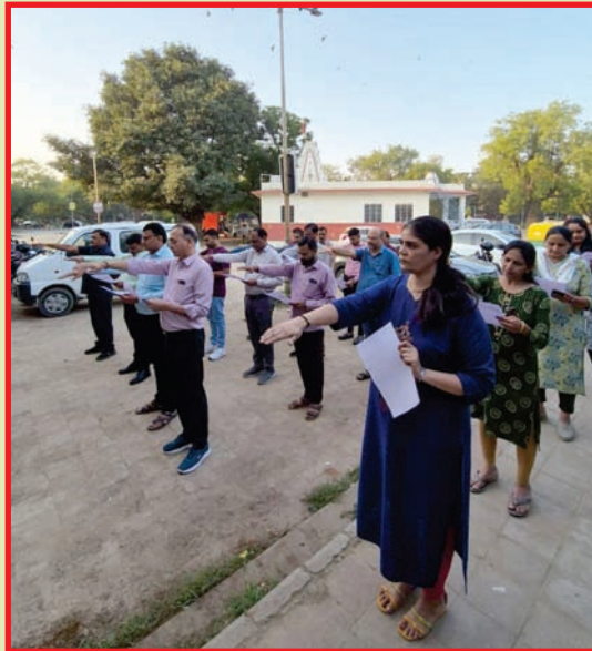
વંદે માતરમ્ ગીતના ૧૫૦મા વર્ષના કાર્યક્રમની તા. ૭-૧૧-૨૦૨૫ના રોજ ઉજવણી દરમિયાન સ્વદેશીના શપથ લેતા બોર્ડ ઓફ ડિરેક્ટર્સ, આમંત્રિત મહેમાન તથા કર્મચારીગણ